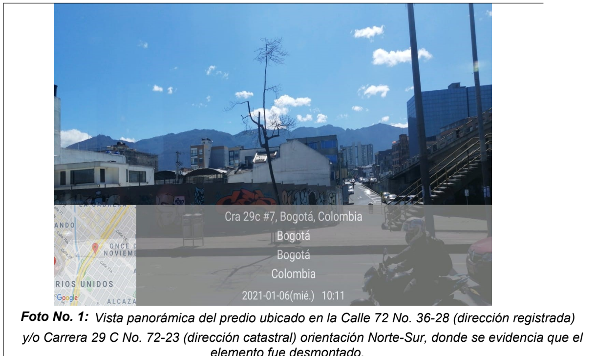
Foto No. 1: Vista panorámica del predio ubicado en la Calle 72 No. 36-28 (dirección registrada) y/o Carrera 29 C No. 72-23 (dirección catastral) orientación Norte-Sur, donde se evidencia que el elemento fue desmontado.